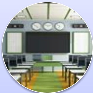
Оснащение информационно - библиотечного центра