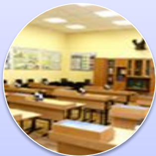
Оснащение кабинета Биологии, Химии, ОБЖ, Музыки