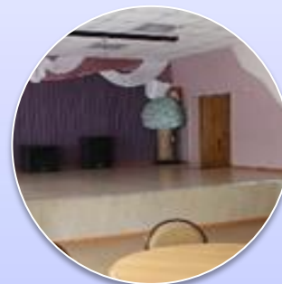
Оснащение актового зала