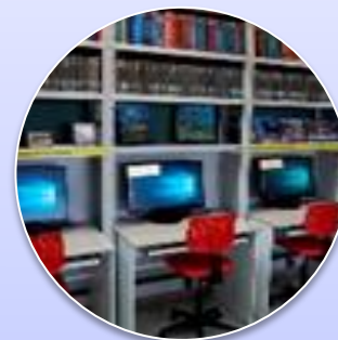
Оснащение медиа центра