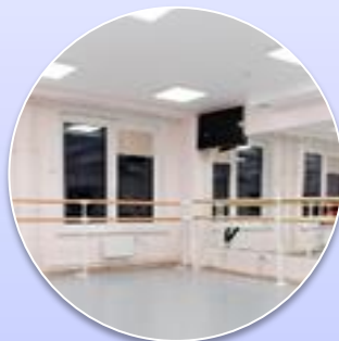
Оснащение балетного зала